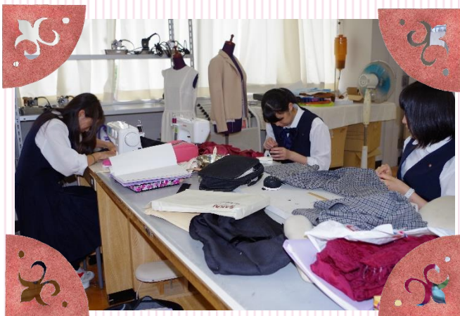
2年生は選択科目のパンツの途中提出日です。