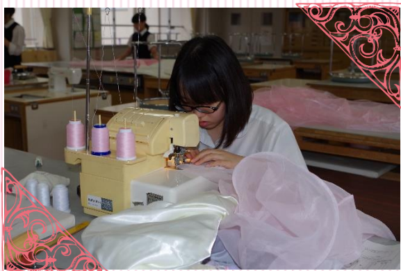
3年生は選択科目のドレスの製作に夢中です